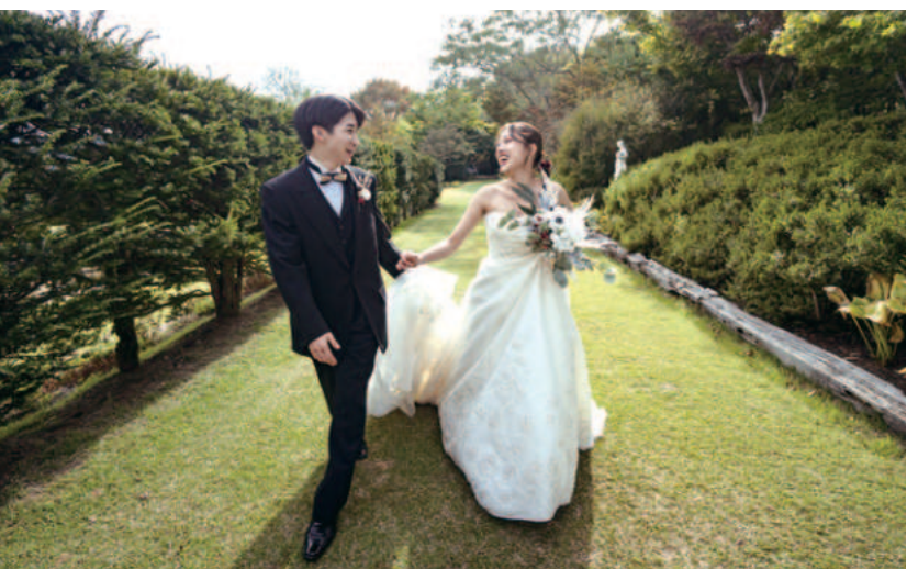
ブライダル科では学生たちが本物の結婚式をプロデュース。