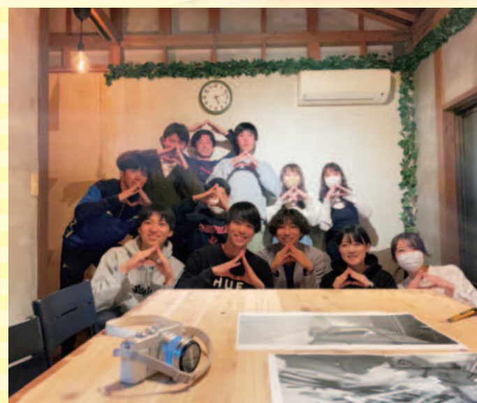
地元の活性化と学生のための新規事業「空き家再生プロジェクト」を立ち上げた仲間。