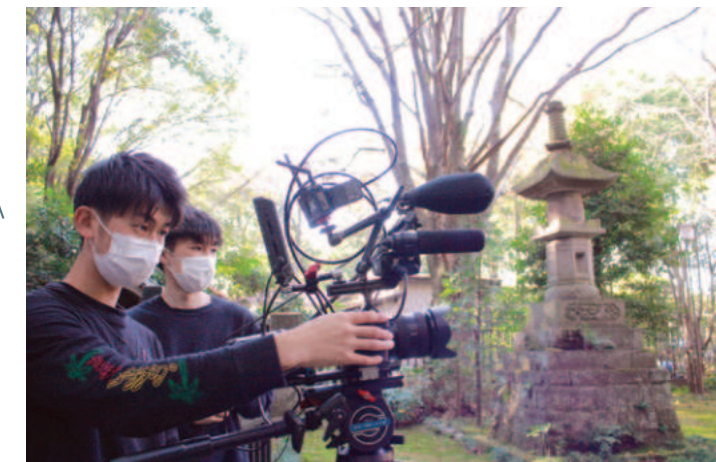
2023年/長野県佐久市で地域活性化につながる起業にチャレンジ