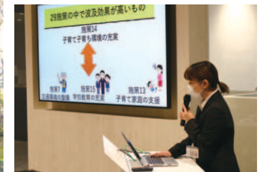
2022年/SDGsをテーマに小金井市の魅力倍増計画を市長にプレゼン