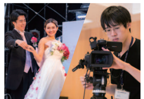
ブライダル科(1・2年次)×放送芸術専攻(3・4年次)