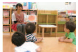
キャンパス内の保育園 「東京工学院きしゃぼん保育園」

子育て応援サークルで親子をサポート 実習室を開放し、地域の親子と触れ合い、近隣の公園に出勤保育も実施。