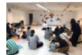
子育て応援サークル 「ちびっこどんぶり」