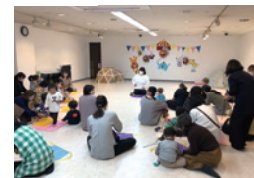
子育て応援サークル 「ちびっこどんぶり」