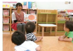
キャンパス内の保育園 「東京工学院きしゃぼん保育園」